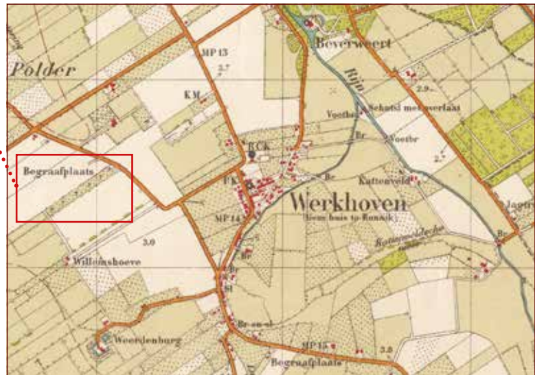
Detail van de topografische kaart van Werkhoven uit 1927. Links wordt de algemene begraafplaats aan de Achterdijk aangegeven en rechts onderin de hervormde begraafplaats aan de Leemkolkweg. In de uitsnede is met een rode punt het baarhuisje aangegeven.

daal. Voor de katholieken had de wet van 1869 geen consequenties. Hun begraafplaats lag op voldoende afstand van de bebouwde kom.